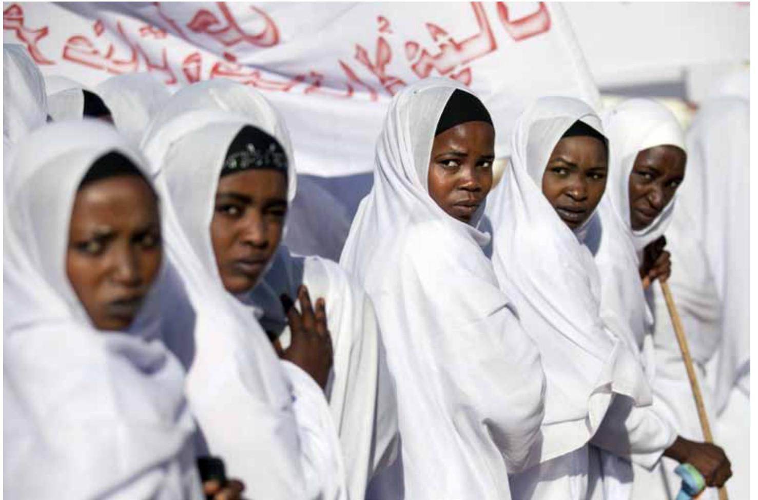
▲ Students from the Midwifery School in El Fasher, North Darfur, participate in a march to commemorate International Women's Day. (11 March 2013)

طالبات من مدرسة القبالات في الفاشر، شمال دارفور، يشاركن في مسيرة للاحتفال باليوم العالمي للمرأة. (11 مارس 2013)