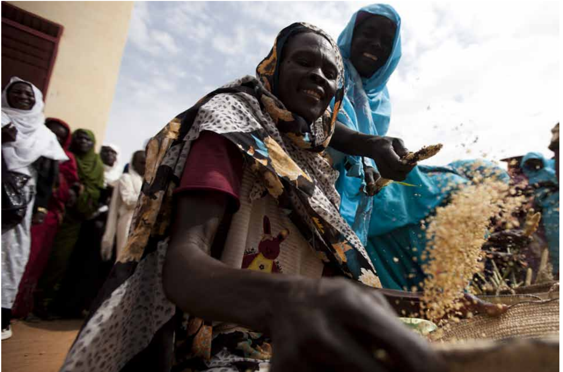
▲ Women in Shagra, North Darfur, work as part of a community cooperative to make flour that later will be sold at market. (18 October 2012)

نساء في شاقرا، شمال دارفور، يعملن في إطار مجتمع تعاوني لصناعة الطحين لبيعه لاحقاً في السوق. (18 أكتوبر 2012)