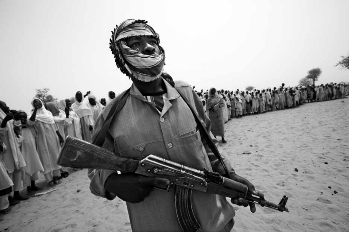
◀ A member of the Sudan Liberation Army (Abdul Wahid faction) in Forog, North Darfur. (30 May 2012)

عضو من جيش تحرير السودان (فصيل عبد الواحد) في فورق، شمال دارفور. (30 مايو 2012)