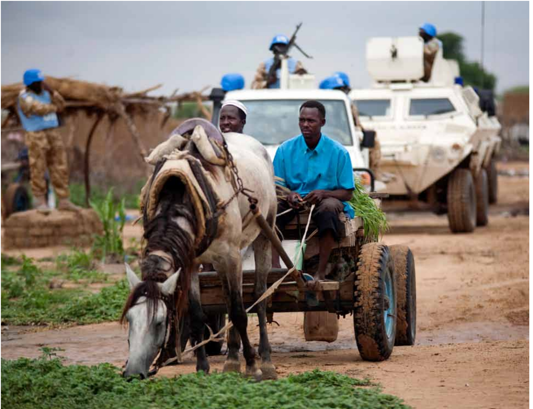
A group of UNAMID peacekeepers keep watch over farmers near the Kalma camp for internally displaced people in South Darfur. (11 August 2011) ▲

مجموعة من قوات اليوناميد لحفظ السلام تؤمن الحماية للمزارعين قرب معسكر كلمة للنازحين في جنوب دارفور. (11 أغسطس 2011)