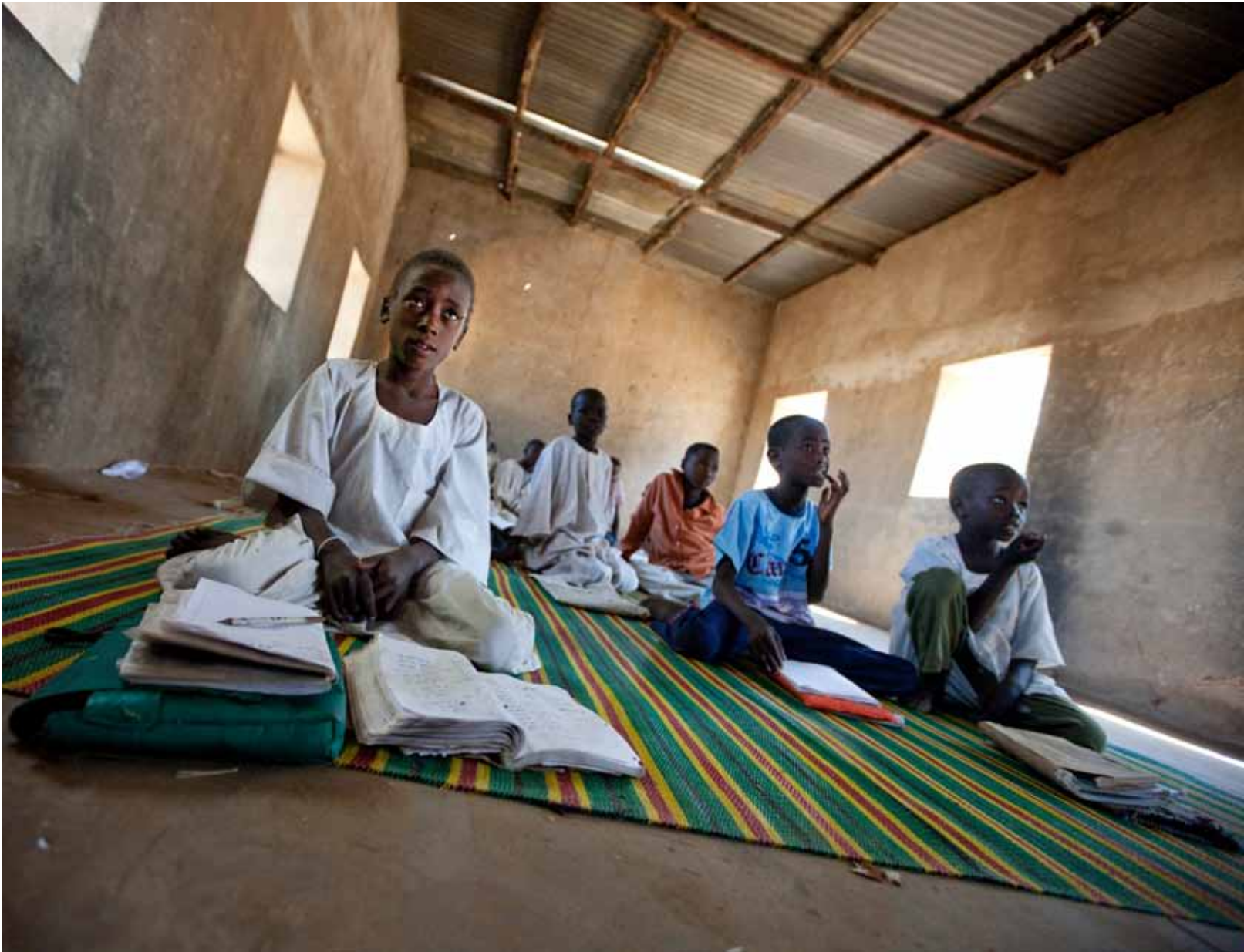
▲ Children sit in a classroom in a local school in Sullu, West Darfur. Three volunteers from the community teach at the school. (23 January 2011)

أطفال يجلسون في الفصول الدراسية في مدرسة في محلية سولو، غرب دارفور حيث يدرس ثلاثة متطوعين من المجتمع المحلي. (23 يناير 2011)