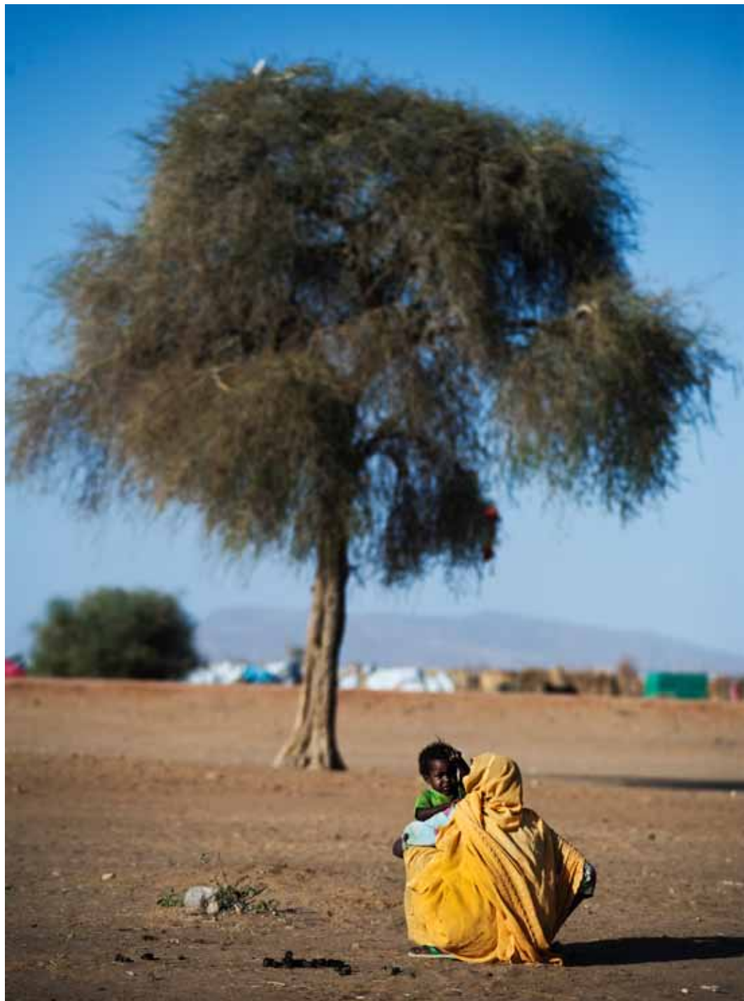
◀ A woman holds her baby near a newly formed camp for displaced people near Shangil Tobaya, North Darfur. (26 January 2010)

إمرأة تحمل طفلها قرب معسكر جديد للنازحين قرب شنقل طوباية، شمال دارفور. (26 يناير 2010)