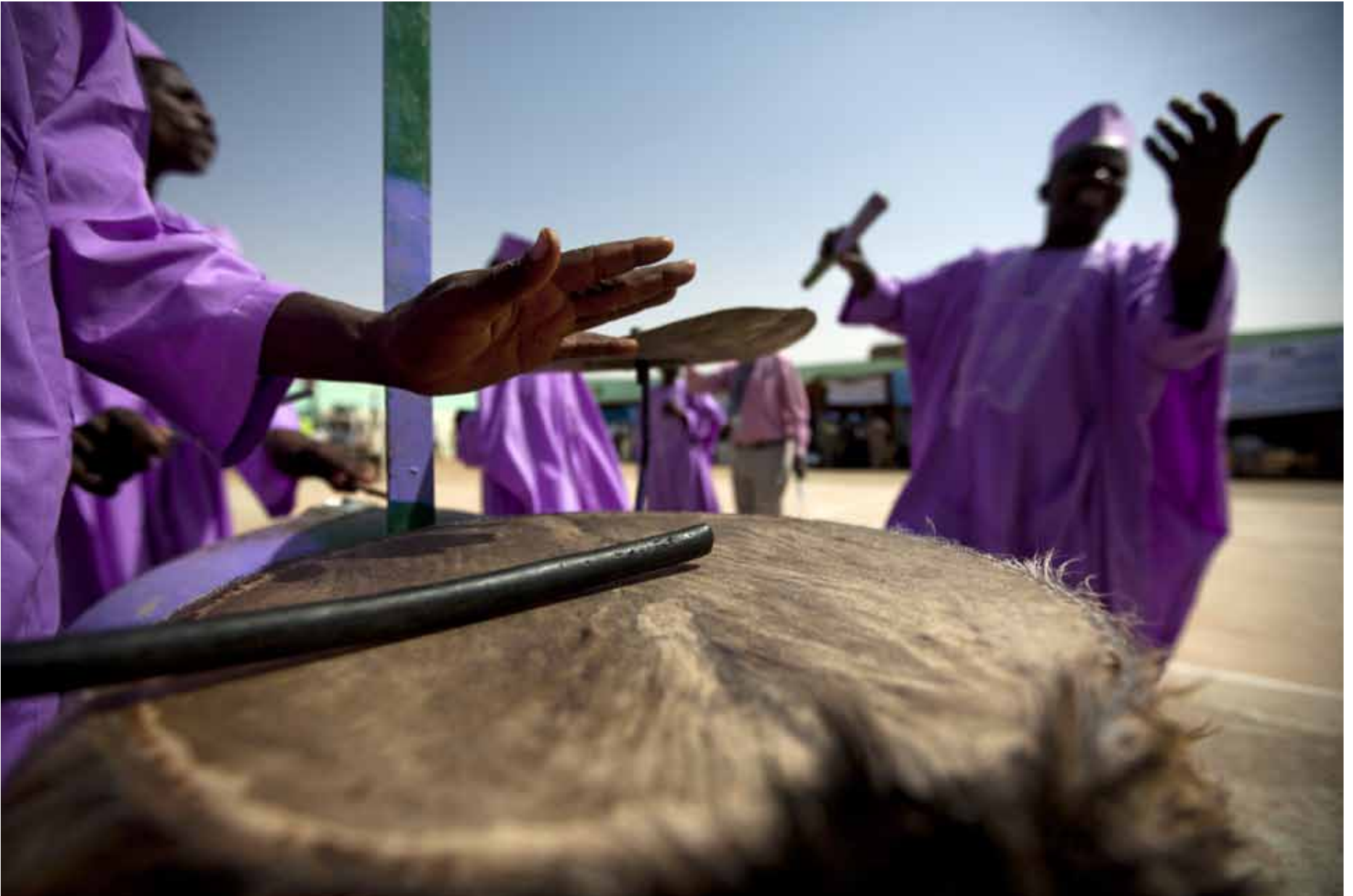
Members of the Falata tribe perform a traditional dance in El Fasher, North Darfur. (24 October 2012) ▲

أفراد من قبيلة الفلّاتة يؤدون رقصات شعبية في الفاشر، شمال دارفور. (24 أكتوبر 2012)