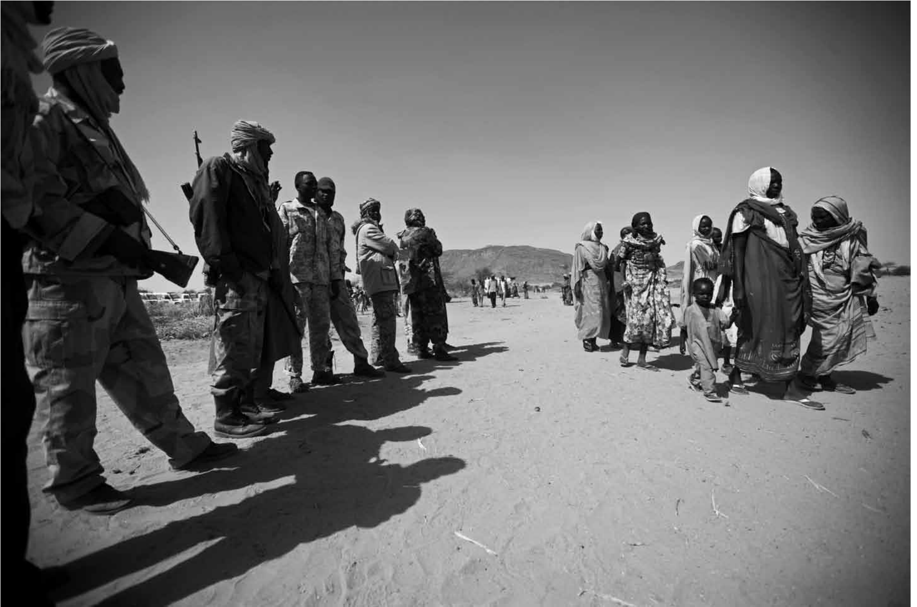
▲ Members of an armed movement escort women and children leaving Tukumare village, North Darfur, due to clashes in the area. (6 February 2011)

أعضاء حركة مسلحة يرافقون النساء والأطفال أثناء مغادرتهم قرية توكوماري، شمال دارفور، بسبب الاشتباكات في المنطقة. (6 فبراير 2011)