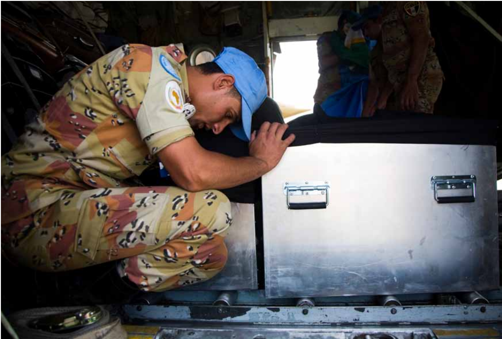
▲ A UNAMID peacekeeper prays beside the coffin containing the body of one of his comrades killed in an ambush near Katia village, South Darfur. (8 May 2010)

فرد من قوات اليوناميد لحفظ السلام يصلي بجوار النعش الذي يحتوي على جثة رفيقه الذي قتل في كمين بالقرب من قرية كاتيا، جنوب دارفور. (8 مايو 2010)