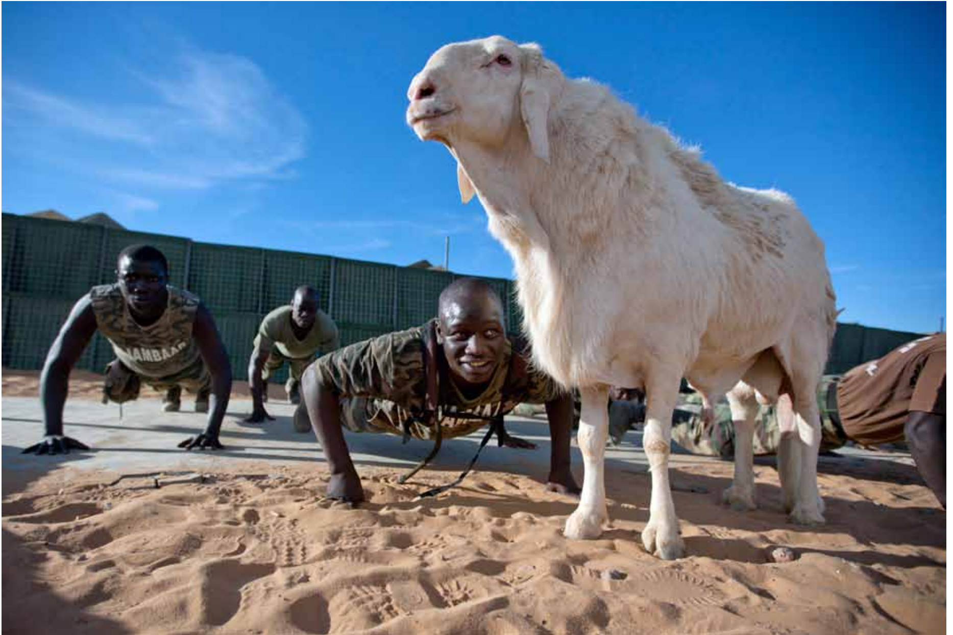
▲ UNAMID soldiers train at a team site in Um Baro, North Darfur, beside their well-groomed pet, an old sheep. Having a sheep nearby is an old tradition in their army. (14 November 2011)

جنود من قوات اليوناميد لحفظ السلام في موقع للبعثة في أم بارو، شمال دارفور، بجانب حيواناتهم الأليفة المهندمة. يعتبر الاحتفاظ بالأغنام على مقربة تقليداً قديماً من تقاليد جيشهم. (14 نوفمبر 2011)