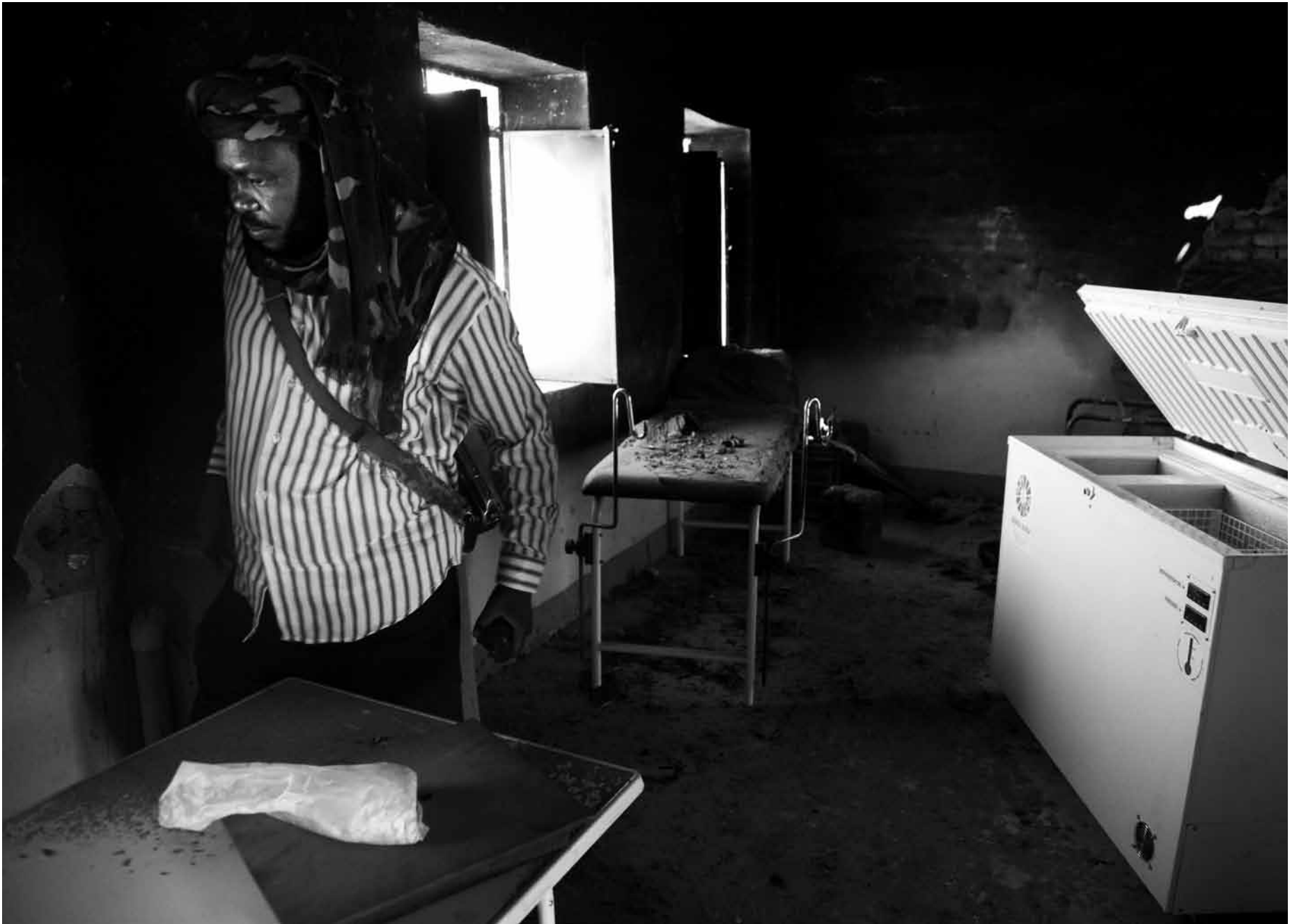
▲ A member of the Sudan Liberation Army (Unity faction) inspects a UNICEF clinic in Majo, North Darfur. The village was looted and burned by armed men, forcing the 27,000 people living in the area to flee. (7 February 2010)