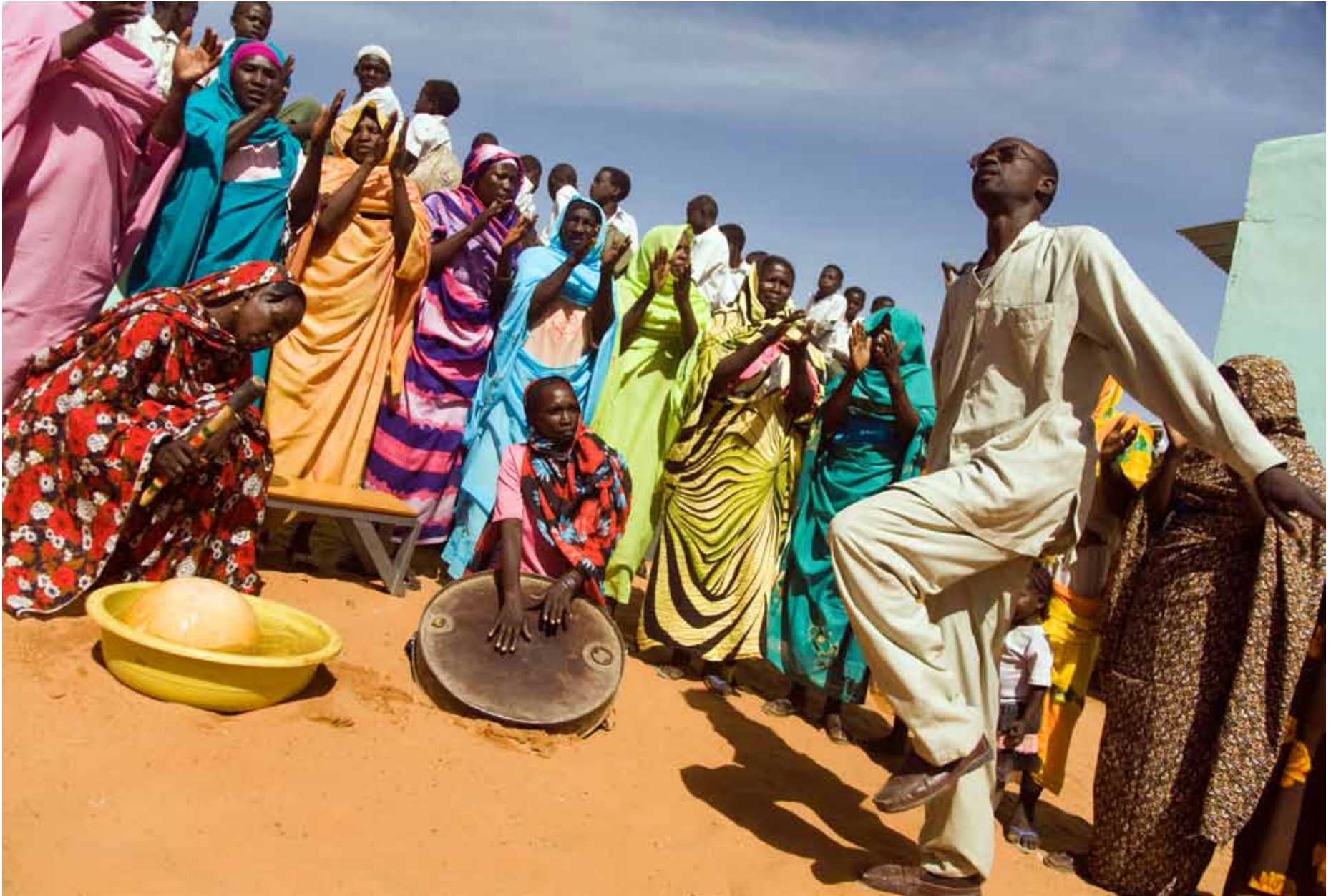
▲ Residents of Swilinga, North Darfur, perform a traditional dance. (3 February 2010)

سكان سويلينقا، شمال دارفور، يؤدون رقصات شعبية. (3 فبراير 2010)