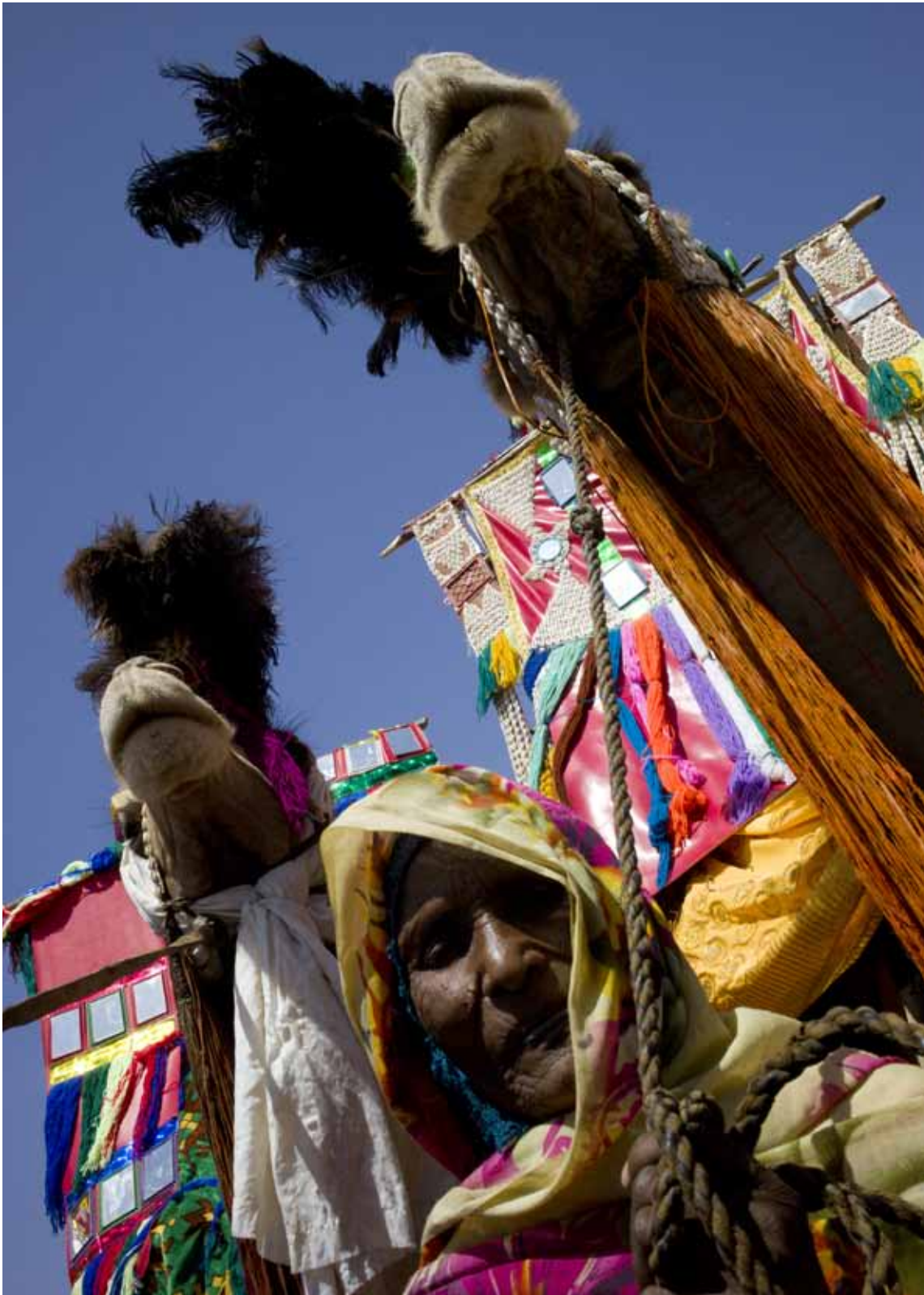
◀ A member of the Mahamid nomadic tribe pictured in Damra Toma, North Darfur. (14 February 2012)

إمرأة من قبيلة محمد البدوية في دامرا توما، شمال دارفور. (14 فبراير 2012)