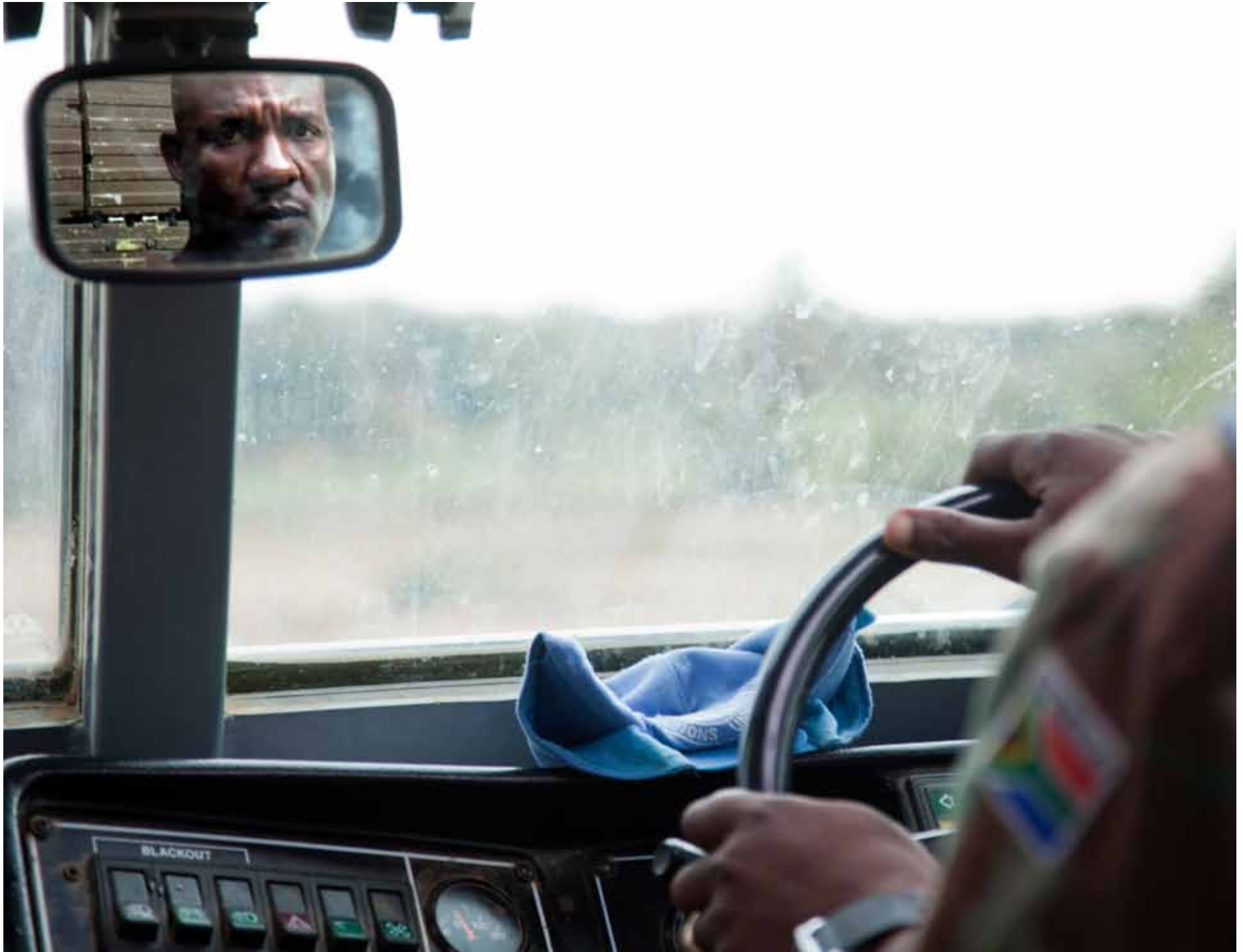
▲ A UNAMID peacekeeper patrols in an armoured personnel carrier in Kutum, North Darfur. (3 August 2010)

فرد من قوات اليوناميد لحفظ السلام يقوم بدورية في ناقلة مدرعة في كتم، شمال دارفور، (3 أغسطس 2010)