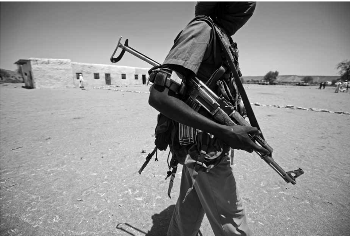
◀ A member of one of the armed movements is pictured in the area of Fanga Suk village in East Jebel Marra. (18 March 2011)

عضو من جيش تحرير السودان (فصيل عبد الواحد) في فورق، شمال دارفور. (30 مايو 2012)