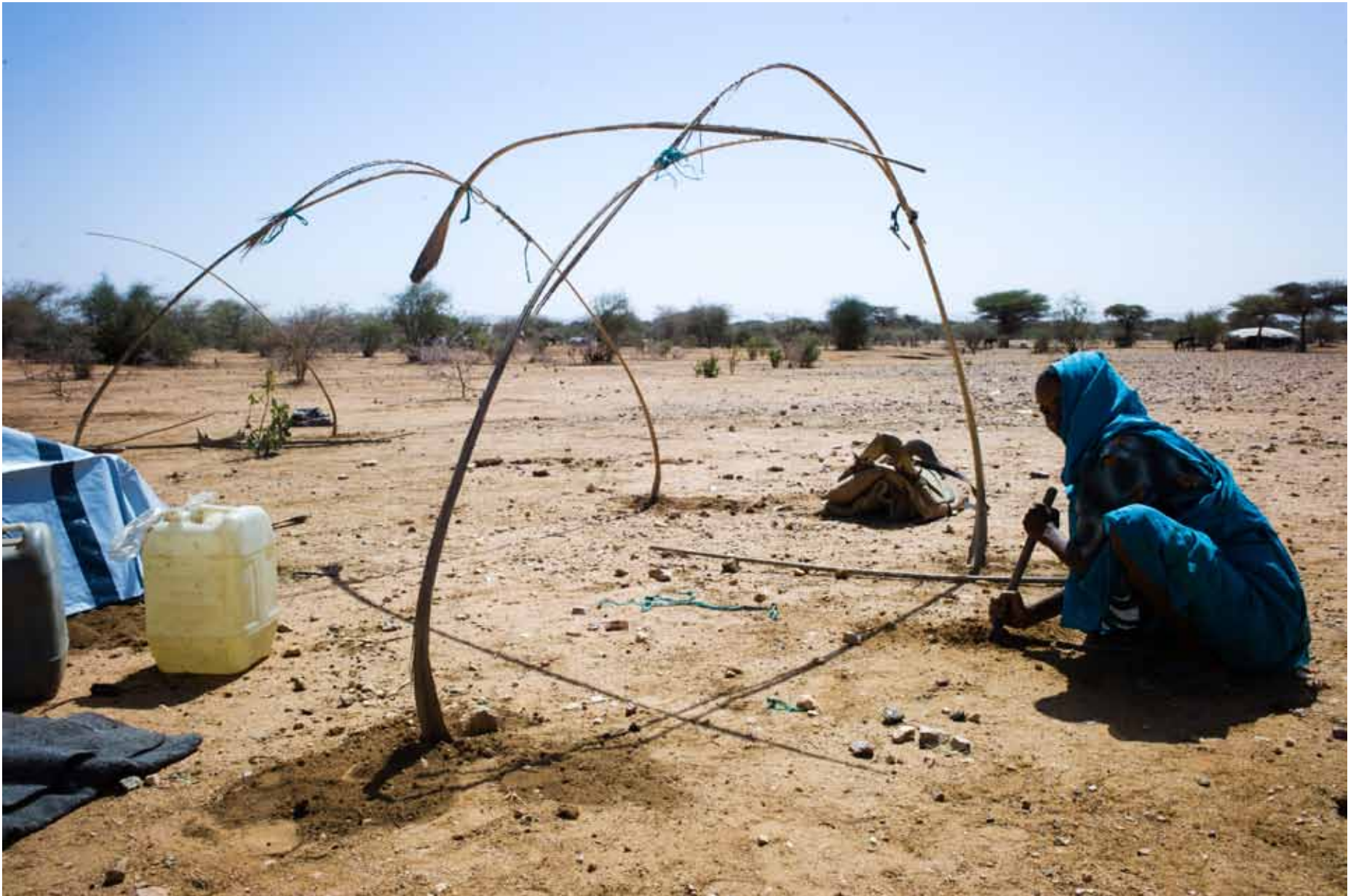
▲ A woman, who had been displaced for nine years in South Darfur, builds a new shelter in Damra Toma, North Darfur. (14 February 2012)

إمرأة نازحة منذ تسع سنوات في جنوب دارفور، تبني مأوى جديداً في دامرا توما، شمال دارفور. (14 فبراير 2012)