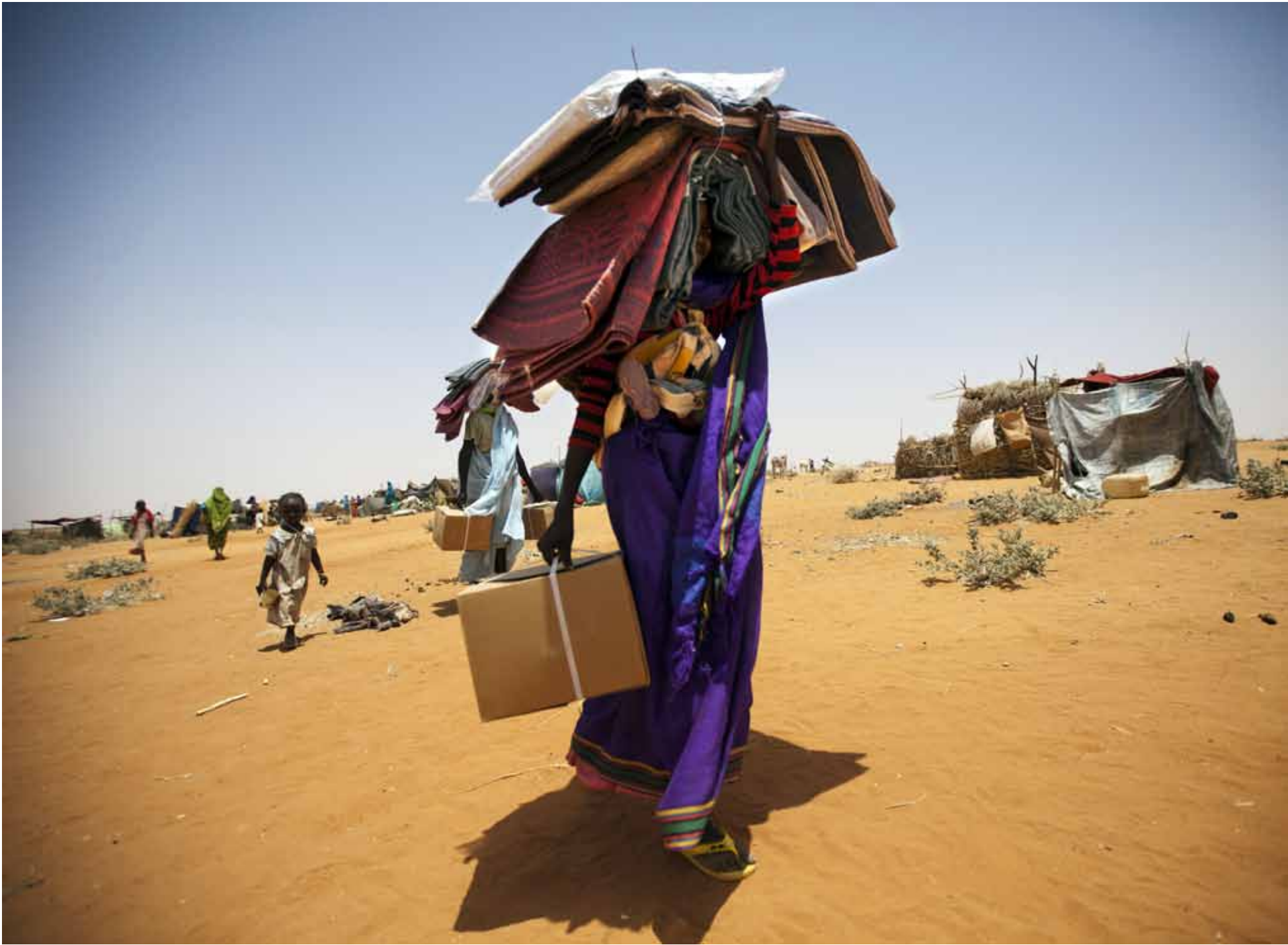
▲ A woman from East Darfur carries humanitarian supplies distributed by UN agencies at a new settlement in Zam Zam camp for internally displaced people in North Darfur. (22 May 2013)

إمرأة من شرق دارفور تحمل مساعدات وزعت من قبل وكالات الأمم المتحدة إلى منزلها في قسم جديد في معسكر زمزم للنازحين في شمال دارفور. (22 مايو 2013)