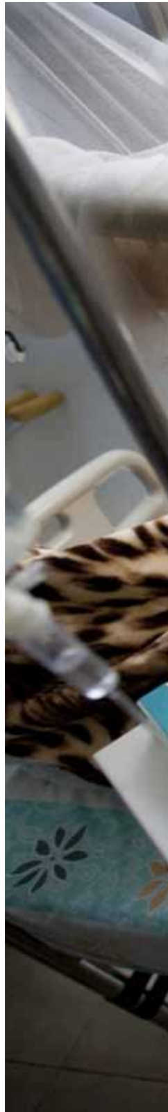
▶ A UNAMID peacekeeper recovers in an El Geneina, West Darfur, hospital after sustaining injuries in an ambush in which four peacekeepers were killed and eight others injured by unidentified assailants. (3 October 2012)

فرد من قوات اليوناميد لحفظ السلام يصلي بجوار النعش الذي يحتوي على جثة رفيقه الذي قتل في كمين بالقرب من قرية كاتيا، جنوب دارفور. (8 مايو 2010)