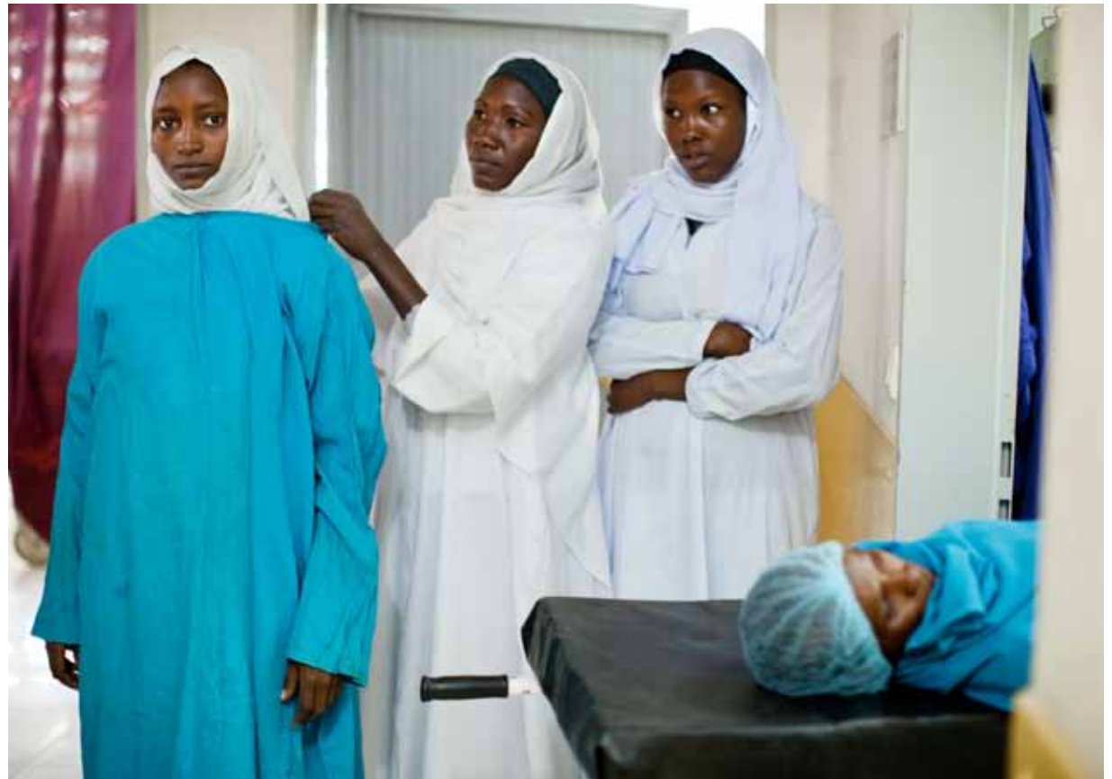
▲ Nurses prepare to assist in a delivery at the Maternity Hospital in El Fasher, North Darfur. (25 January 2012)

ممرضات يستعدن للمساعدة في ولادة في مستشفى الولادة في الفاشر، شمال دارفور. (25 يناير 2012)