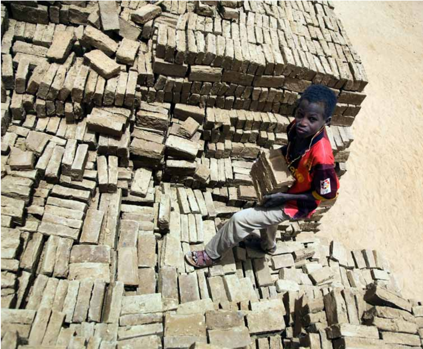
▲ A child helps his family make bricks in Tora, North Darfur. (19 April 2010)

طفل يساعد أسرته في صناعة الطوب في طورا، شمال دارفور. (19 أبريل 2010)