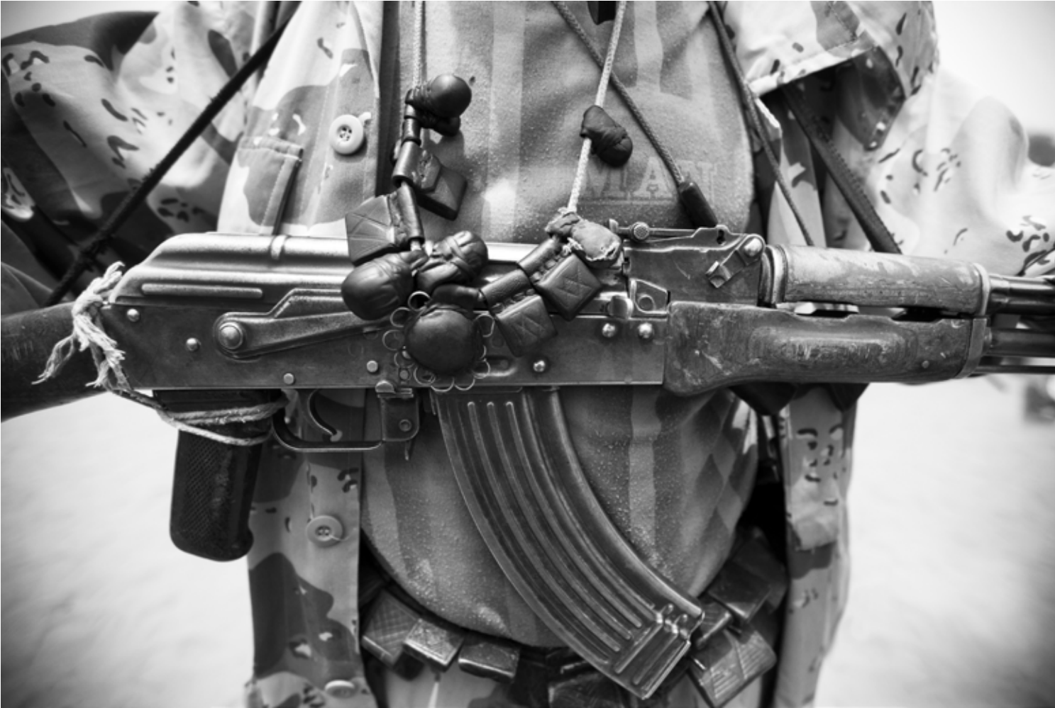
▲ A member of the Sudan Liberation Army (Abdul Wahid faction) wearing hijabs (amulets designed to offer protection from harm) is pictured near Forog, North Darfur. (30 May 2012)

صورة لعضو في جيش تحرير السودان (فصيل عبد الواحد) يضع حجابات (تمائم مصممة لتوفير الحماية من الضرر)، بالقرب من فورق في شمال دارفور. (30 مايو 2012)