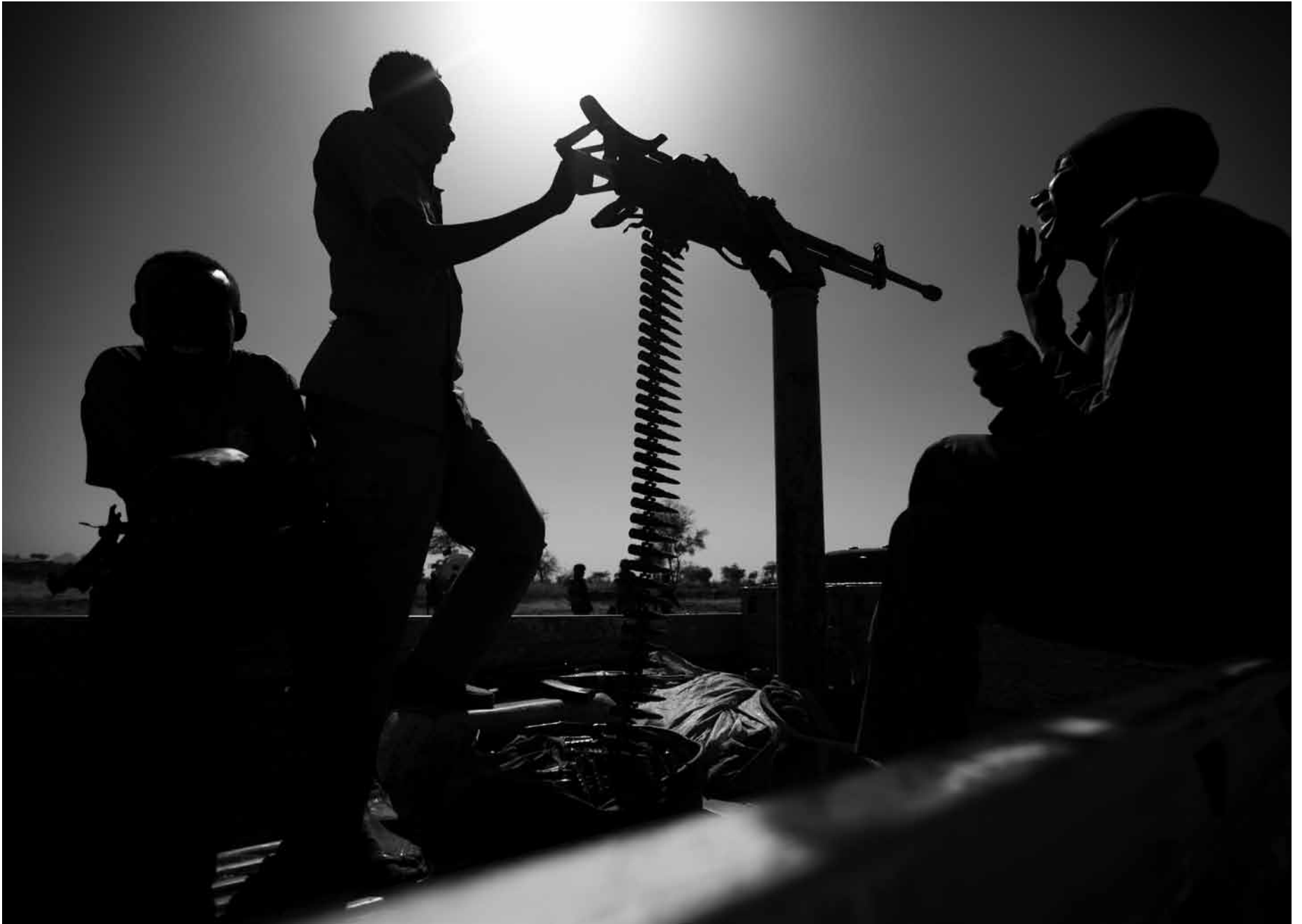
▲ Members of the Sudanese Army maintain vigilance in Jawa village, in the area of East Jebel Marra. (18 March 2011)

أفراد من الجيش السوداني يسهرون على الأمن في قرية جاوا، في منطقة شرق جبل مرة، (18 مارس 2011)