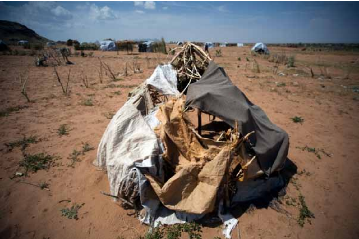
▲ New shelters built in Tawilla, North Darfur, by people displaced from Fanga and Taraba. Residents were forced to evacuate their villages due to armed clashes. (26 September 2010)

ملاجئ جديدة بنيت في قرية طويلة، شمال دارفور، بواسطة النازحين من فنقا وترابا حيث أجبر السكان على إخلاء قراهم بسبب الاشتباكات المسلحة. (26 سبتمبر 2010)