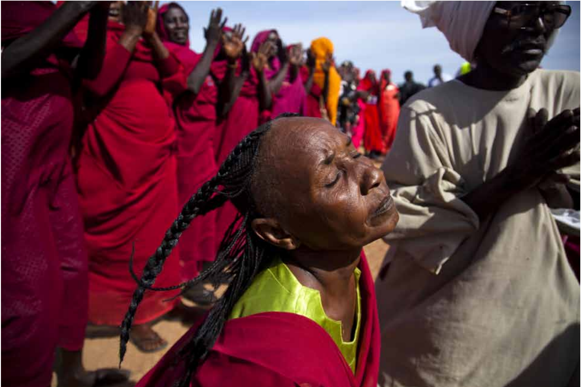
▲ Members of the Rezeigat tribe in El Daein, East Darfur, perform traditional dances and songs. (3 December 2012)

أفراد من قبيلة الرزيقات في الضعين، شرق دارفور، يغنون ويؤدون الرقصات الشعبية. (3 ديسمبر 2012)