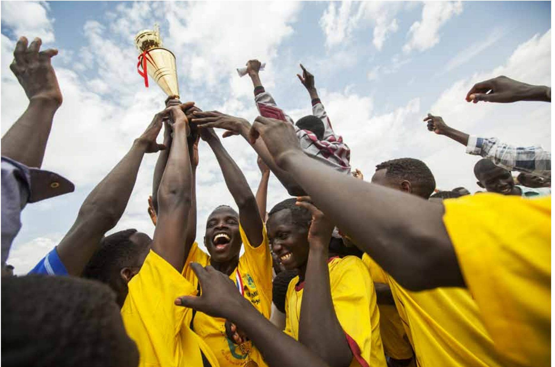
Football players celebrate their first place victory during the closing ceremony of a community football competition in the Zam Zam camp for internally displaced people near El Fasher, North Darfur. (24 June 2013) ▲

لاعبو كرة قدم يحتفلون بانتصارهم بالمركز الأول خلال الحفل الختامي لمسابقة كرة القدم المقامة في معسكر زمزم للنازحين قرب الفاشر، شمال دارفور. (24 يونيو 2013)