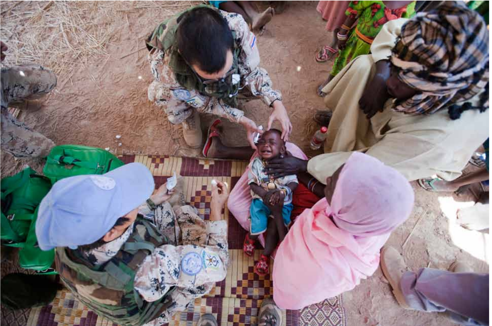
▲ A UNAMID doctor attends to sick children in Buru, West Darfur. The nearest medical clinic is 30 kilometres away. (30 March 2011)

طبيب من اليوناميد يفحص الأطفال المرضى في بورو، غرب دارفور. أقرب عيادة طبية تبعد حوالي 30 كيلومتراً. (30 مارس 2011)